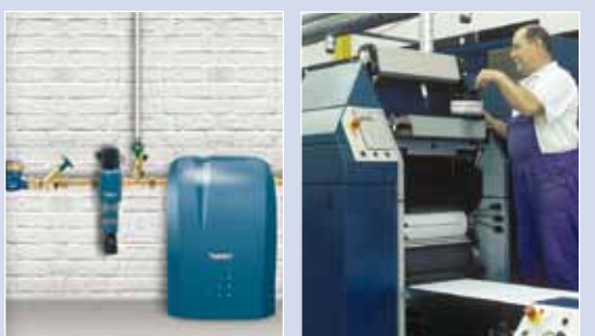
BWT AQA life – Enthärtung auf kleinstem Raum