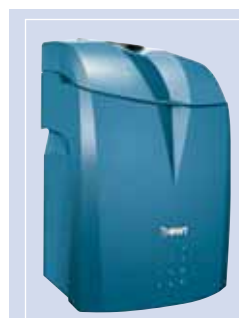
BWT AQA perla – innovativ und effizient

AQA perla arbeitet nach dem bewährten Ionenaustauschverfahren und wurde speziell im Hinblick auf Sicherheit, Ökologie, Ökonomie und Hygiene optimiert. Salzwasser und Trinkwasser kommen nie miteinander in Berührung. Der Regenerations- und der Trinkwasserkreislauf sind komplett voneinander getrennt. So ist stets beste Trinkwasserqualität garantiert. Die innovative Präzisionsbesatzung mittels "Solemeser" steht für sparsamsten Verbrauch an Salz und Spülwasser.