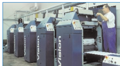
pour les imprimeries offset.