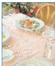
Pour une vaisselle éclatante ...

Là où de l'eau pure et avantageux est demandée, PERMAQ® Eco entre en action.