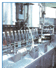
pour l'industrie alimentaire ...