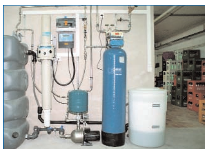
Pour la gastronomie ...