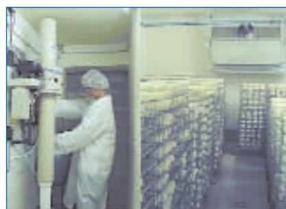
ou pour humidifier l'air dans les fromageries.