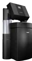
BWT Rondomat Duo/Duo S