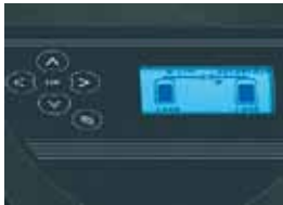
Steuerung Soft Control

Die Steuerungselektronik Soft Control der Pendel-Enthärter ELITE Rondomat Duo und AQA perla steuert die alternierende Hygienefahrweise, bei der in kurzen Intervallen jede Säule im Wechsel angesteuert wird. Dies bringt hygienische Sicherheit, da praktisch kein Wasser in den Enthärtersäulen stehen bleibt.