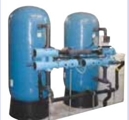
ELITE Pro Duo und Vario Duo