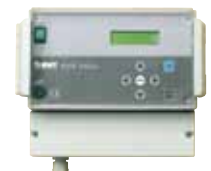
Steuerung ELITE Soft Pro

Die Pendel-Enthärter der Produktreihe ELITE Pro Duo und Vario verfügen über die Steuerungselektronik ELITE Soft Pro. Bei dieser Fahrweise wird die Säule, die gerade nicht in Betrieb ist, erst kurz vor Wiedergebrauch regeneriert. Somit steht für den Betrieb immer eine frisch desinfizierte Enthärtersäule zur Verfügung.