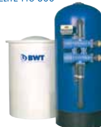
ELITE Pro 300