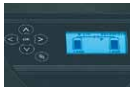
Commande Soft Control

La commande électronique Soft Control équipant nos adoucisseurs ELITE Rondomat Duo et AQA perla pilote leur mode opératoire en duplex assurant l'hygiène de ces appareils en activant chacune des deux colonnes en alternance et à des intervalles brefs. C'est dans ce mode que réside le secret de l'hygiène et de la sécurité de fonctionnement offertes par ces appareils, vu qu'il n'y a pratiquement pas d'eau stagnante dans les colonnes d'adoucisseur.