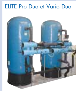
ELITE Pro Duo et Vario Duo