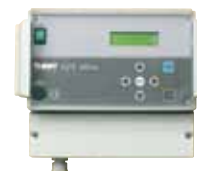
Commande ELITE Soft Pro

Les adoucisseurs duplex de nos gammes ELITE Pro Duo et Vario sont équipés de la commande électronique ELITE Soft Pro. Le mode opératoire en alternance de ces adoucisseurs consiste à ne régénérer la colonne inactive que peu avant sa réactivation . De cette manière, ces adoucisseurs disposent toujours d'une colonne fraîchement désinfectée.