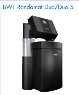
BWT Rondomat Duo/Duo S