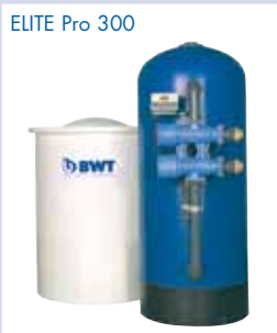
ELITE Pro 300