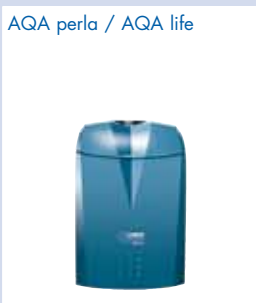
AQA perla / AQA life