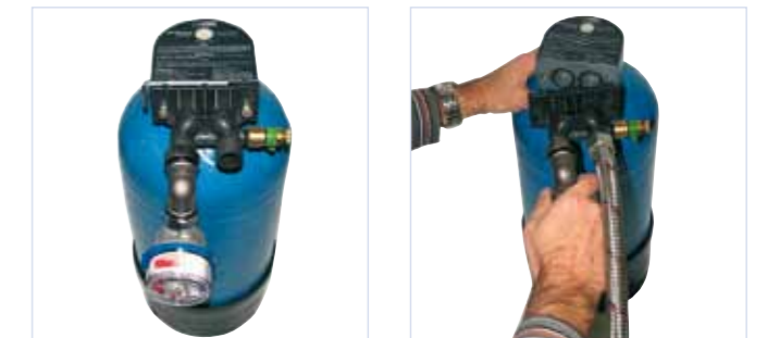
Einfach und unkompliziert

Dank dem neuen Patentverschluss ist ein Patronenwechsel in wenigen Sekunden erledigt. Auch die innovative Trinkwassererschneide-Armatur lässt sich problemlos anschliessen.